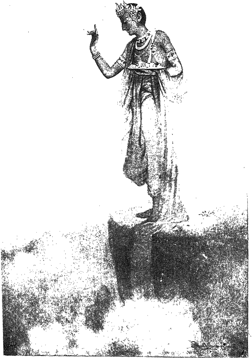
मेघ-दूत की सजल कल्पना